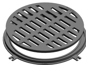
Redonda 50 D400

*Modelo com eixo, dobradiça, sistema de fecho cônico e apoio elástico anti-ruído Model with hinge, conical closing system and elastic anti-noise seating