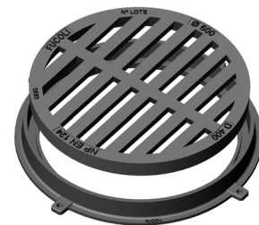
Redonda 60 D400